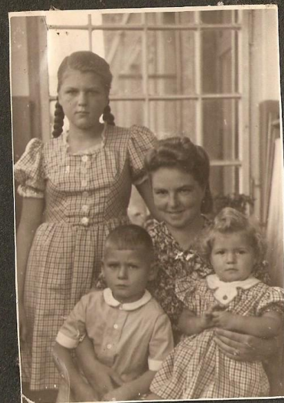
Trójka rodzeństwa z ukochaną mamusią