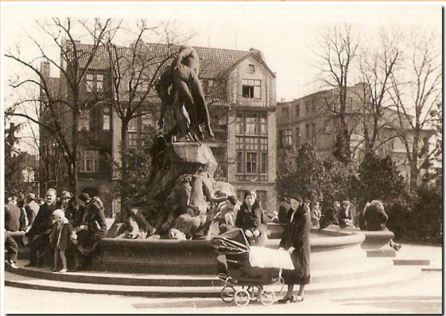
z oddalonej ul. Nakielskiej dotarły aż pod fontannę POTOP do śródmieścia