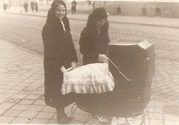
Pierworodna córka Inga